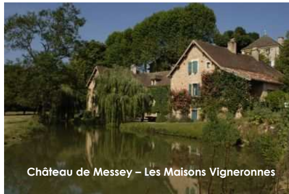
Château de Messey – Les Maisons Vignerones